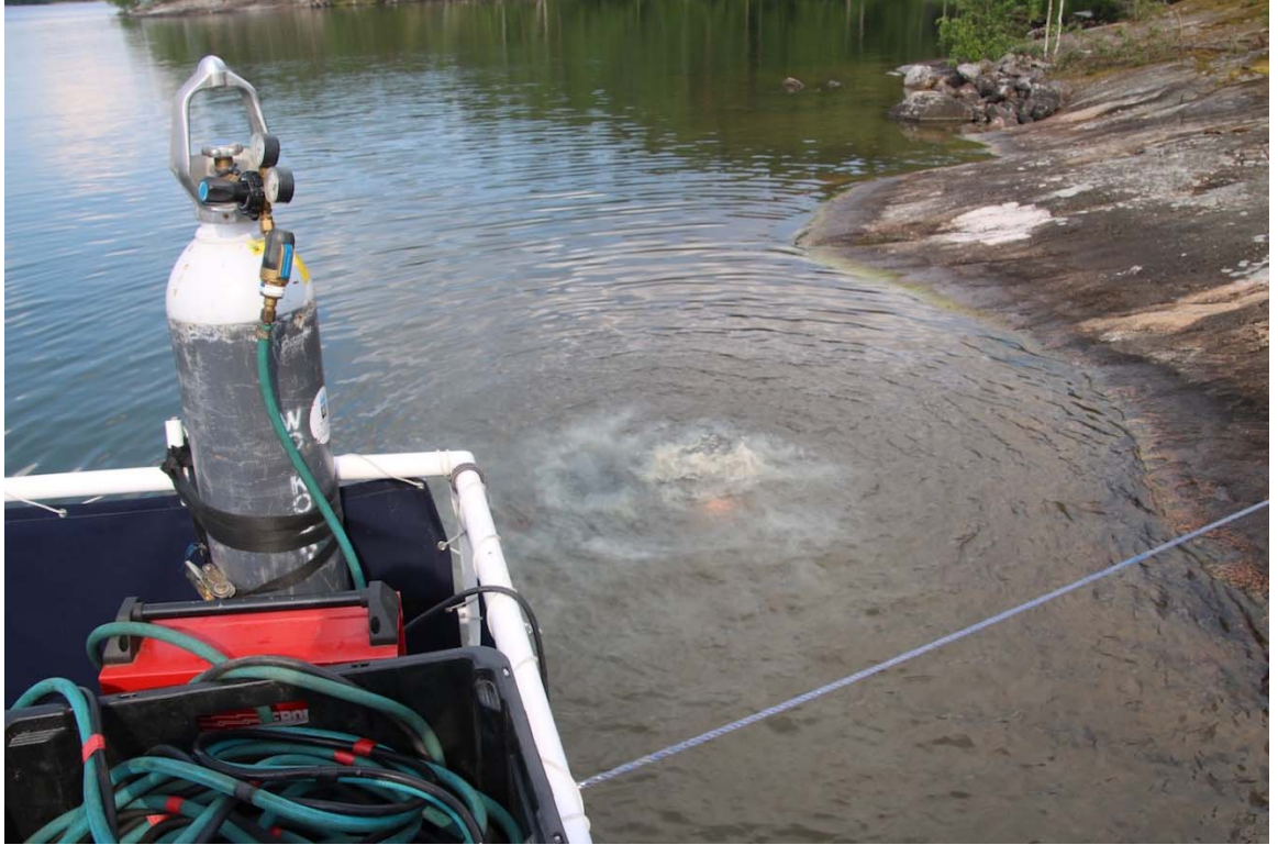
(Kuva: Sukellustoimintaa Hännysaaren rannalla 2019)